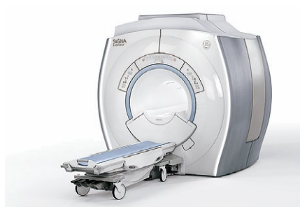
1.5T MRI (磁気共鳴断層撮影) 装置 GEヘルスケア・ジャパン Signa explorer 1.5T