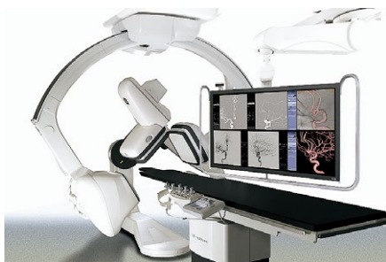
脑血管撮影装置 GEヘルスケア・ジャパン INNOVA IGS6 630