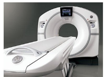
64列マルチスライスCT装置 GEヘルスケア・ジャパン Revolution EVO EX