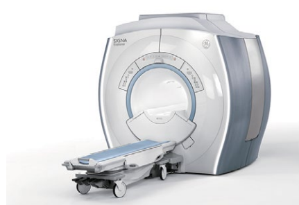
1.5T MRI (磁気共鳴断層撮影) 装置 GEヘルスケア・ジャパン Signa explorer 1.5T