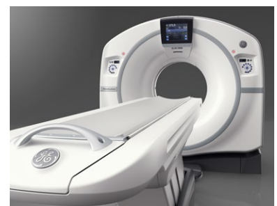
64列マルチスライスCT装置 GEヘルスケア・ジャパン Revolution EVO EX