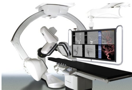
脳血管撮影装置 GEヘルスケア・ジャパン INNOVA IGS6 630