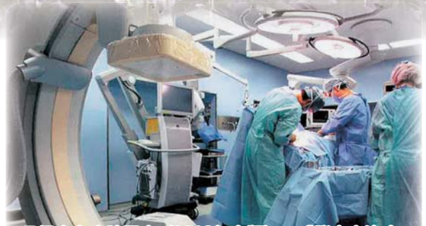
日経実力病院調査(2013年度版)で「脳卒中治療、 ワンストップで」でハイブリッド手術室など機能集約 が紹介されました。

広報紙『きずな』へのご希望・ご意見を http://www.junshin.or.jp/ または F a xでお寄せ下さい。