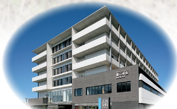
週刊ダイヤモンド誌 10/27号で「脳梗塞の治療数が多い病院」全国1位として紹介されました。