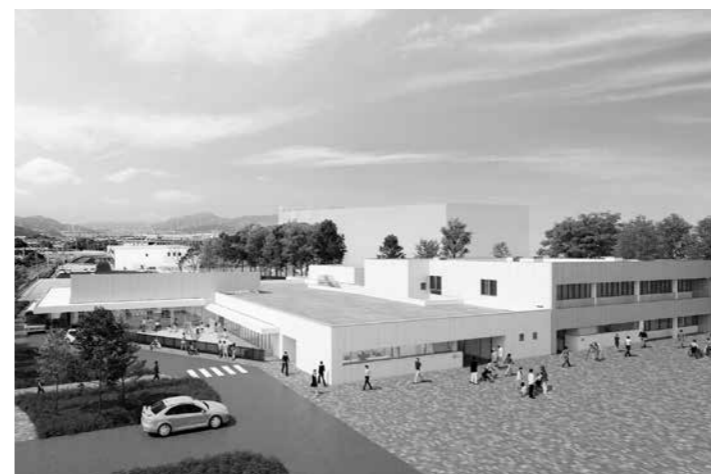
「障がい者ケアセンターかんの」、「総合在宅ケアセンターかんの」