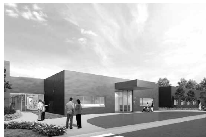
れい和小すもす園

名称：総合在宅ケアセンターかんの 所在地：加古川市神野町神野186-10 設置者：社会医療法人社団 順心会