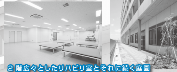
2階広々としたリハビリ室とそれに続く庭園