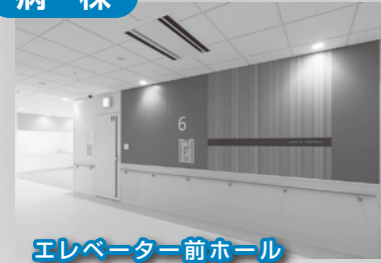
エレベーター前ホール