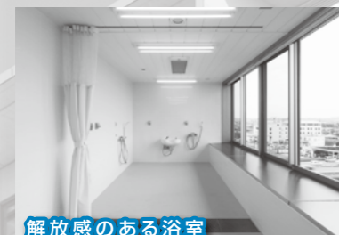
解放感のある浴室