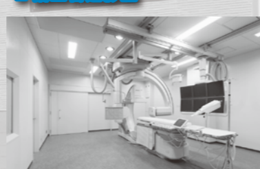
2階ハイブリッド手術室

2階手術室は3室に加え、ハイブリッド手術室、血管造影室、3T MRI、64列マルチスライスCT、超音波エコー、内視鏡システムが完備。迅速に高度な検査と治療が可能。