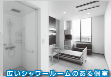
広いシャワールームのある個室