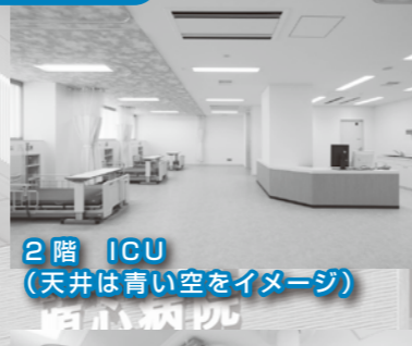
2階 ICU (天井は青い空をイメージ)