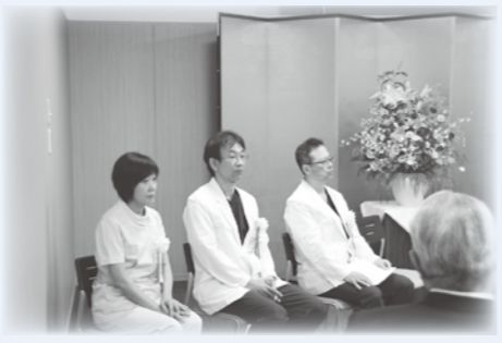
左から 弁野副院長、橋本副院長