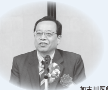
加古川医師会 枝川会長