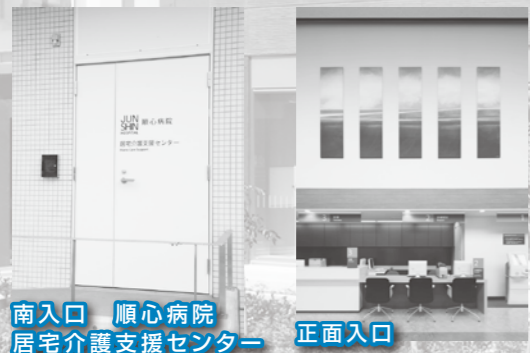
南入口 順心病院 居宅介護支援センター 正面入口