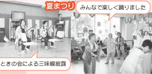
夏まつり みんなで楽しく踊りました