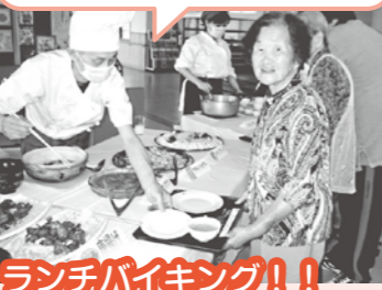
ランチバイキング!!!

いつもとは違った食事を食べました。「とっても美味しかったよ」と喜びの声をたくさん貰いました。初めてのバイキング方式だった利用者様もあられたので、とても満足した時間を過ごせました。