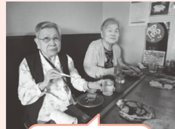
外食会(お好み焼き)