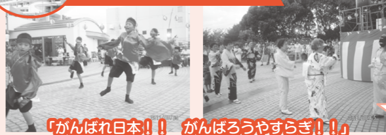
「がんばれ日本!! がんばろうやすらぎ!!!」

「毎年恒例の納涼祭を開催しました。本格的な屋台も用意され賑やかに行われるので皆様楽しみにしております。」