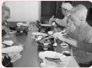
わだつみの宿へお食事ツアーに 行ってきました。淡路牛に舌鼓！