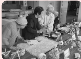
入居者様の作品展示会