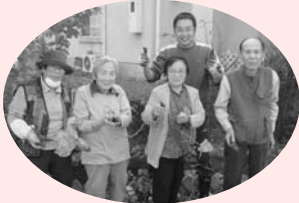
さつまいもの収穫祭(^o^)/