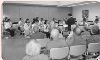
洲本吹奏楽団の演奏会