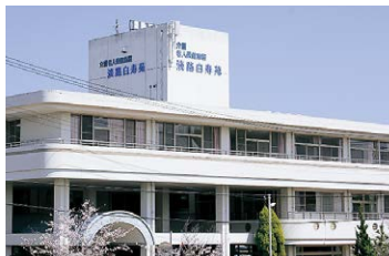
■ 介護老人保健施設 淡路白寿苑