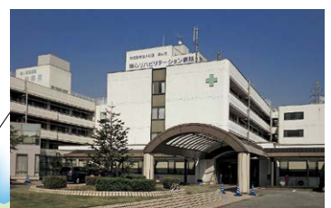
■ 順心リハビリテーション病院 ■ 加古川脳神経・認知 リハビリテーション研究センター ■ 地域リハビリテーションセンター