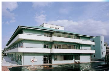
■ 介護老人保健施設 加古川白寿苑