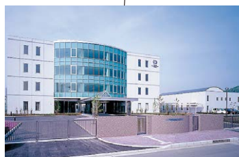
■ 関西総合リハビリテーション専門学校