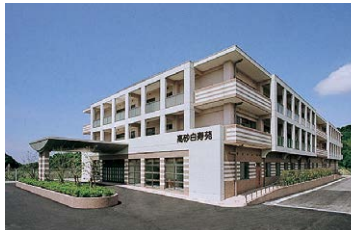
■ 介護老人保健施設 高砂白寿苑