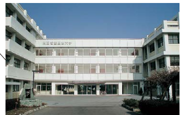
■ 関西看護医療大学