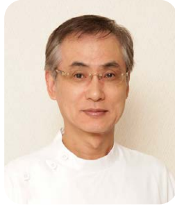
社会医療法人社団順心会 理事長