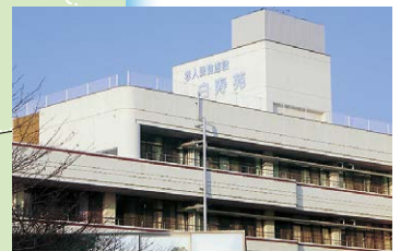
■ 介護老人保健施設 白寿苑