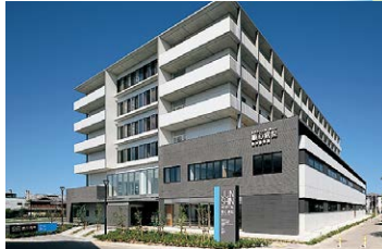
■ 順心病院 ■ サイバーナイフセンター