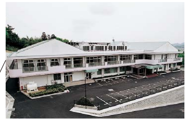
■ 介護老人保健施設 加西白寿苑