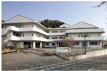
■ 介護老人保健施設 夢前白寿苑